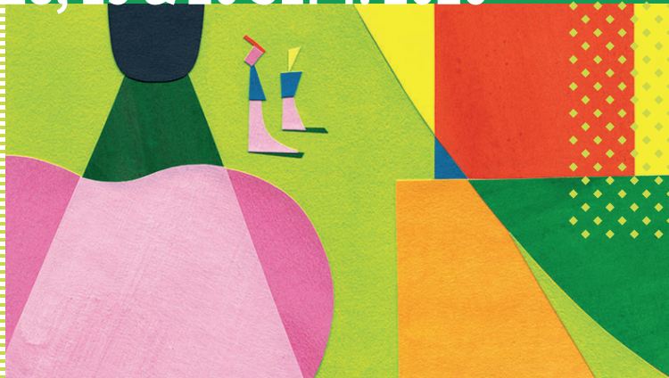
Illustration : ©Jérémie Fischer

PATRIMOINE & ÉDUCATION : APPRENDRE POUR LA VIE !