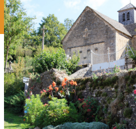
Église de Velogny