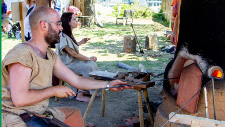
Centre d'interprétation MuséoParc Alésia