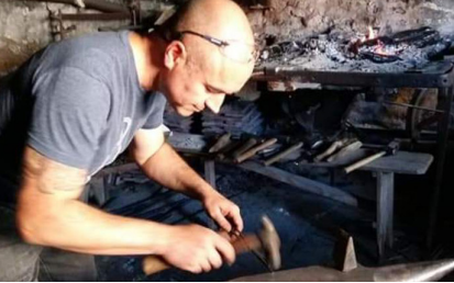
Forge de Thenissey